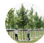
Konsultointi & neuvontapalvelu