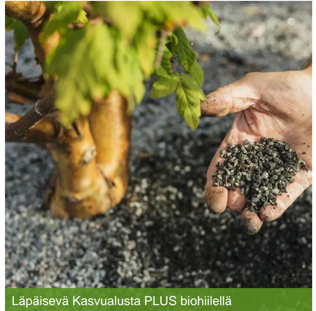
Lämpäisevä Kasvualusta PLUS biohiilellä