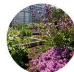
Erikoiskasvialustat (kasvikatot, urheilu & golf, maanparannus)