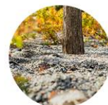
Kasvialustat (nurmikko, niityt, istutusalueet, katupuut, hulevesikohteet, kasvikatot)