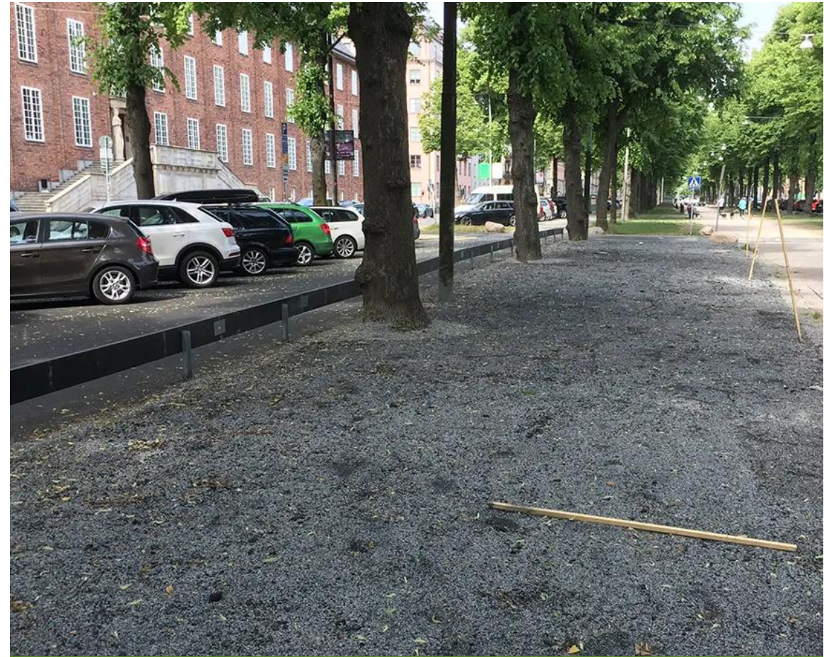
Kungsträgården, Tukholma: Lämpäisevä Kasvualusta PLUS biohiilellä